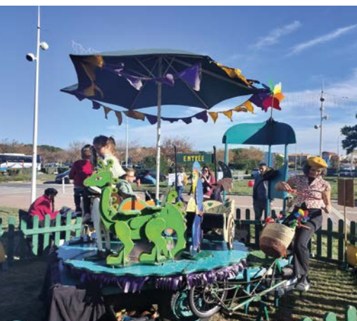
Les 15 et 16 novembre, le Palais des congrès vous a invité à entrer dans un monde où l'enfance est reine