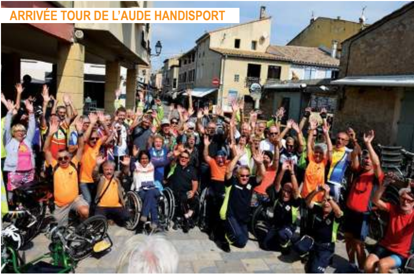
ARRIVÉE TOUR DE L'AUDE HANDISPORT