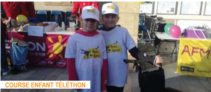
COURSE ENFANT TÉLÉTHON