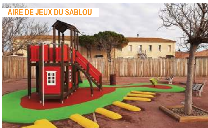
AIRE DE JEUX DU SABLON