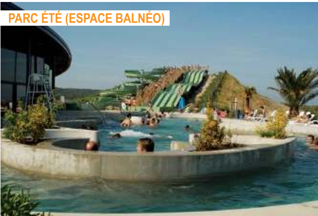
PARC ÉTÉ (ESPACE BALNÉO)