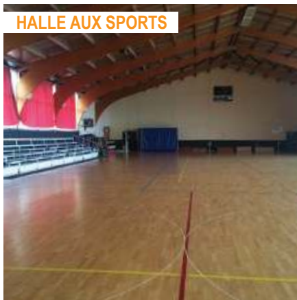
HALLE AUX SPORTS